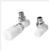
Valvola elegant a squadra con testa termostatica bianco R01

Attacco Multistrato Ø 16 Codice 5991990311216