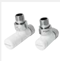
Valvola elegant a squadra manuale bianco R01

Attacco Rame Ø 12/14/15 Codice 5991990310553