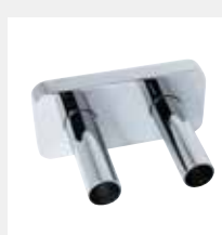
Kit copritubo int. 50 per valvole lucide

Attacco Multistrato Ø 16 Codice 5991990310538