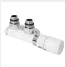
Valvola tinta int. 50 a squadra con testa termostatica dx bianco R01

Attacco Multistrato Ø 16 Codice 5991990310552