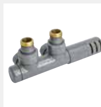
Valvola tinta int. 50 a squadra con testa termostatica dx bianco R01

Attacco Multistrato Ø 16 Codice 5991990310542